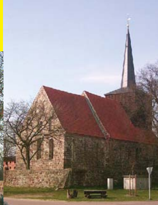
St. Johannes Hohenselchow