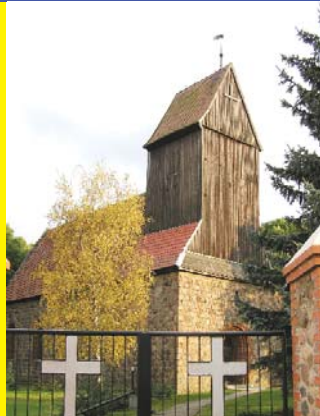
St. Katharinen Groß Pinnow